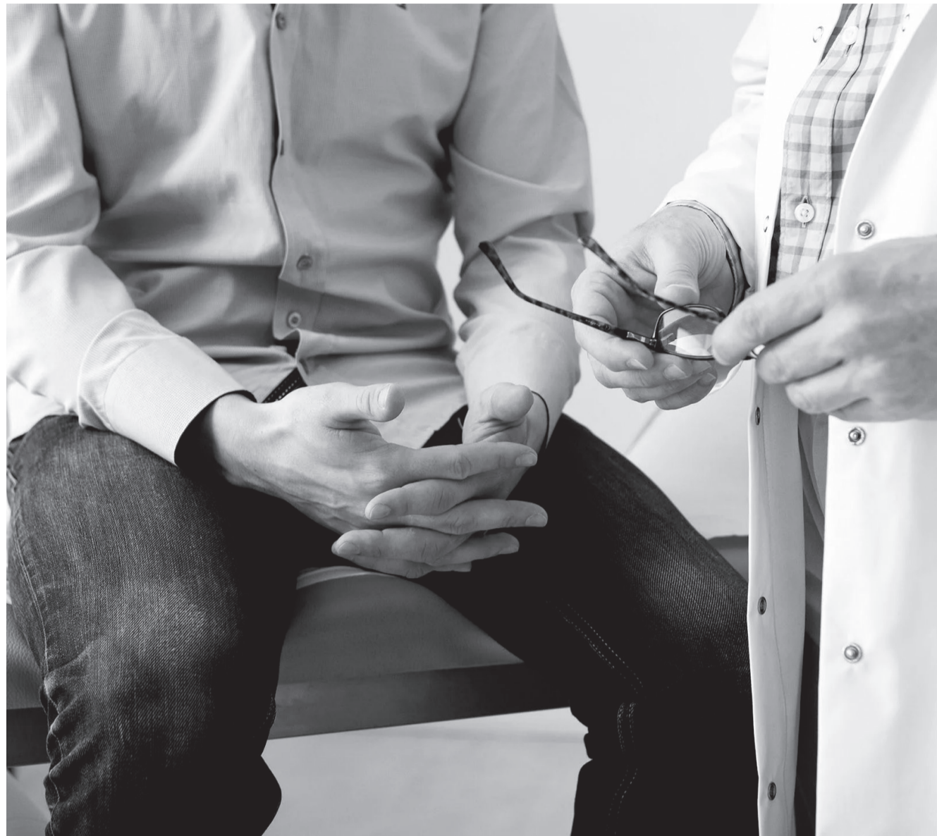
Гос.лицензия №00184DL от 28.06.2007года выдана Управлением Здравоохранения ЭКО.